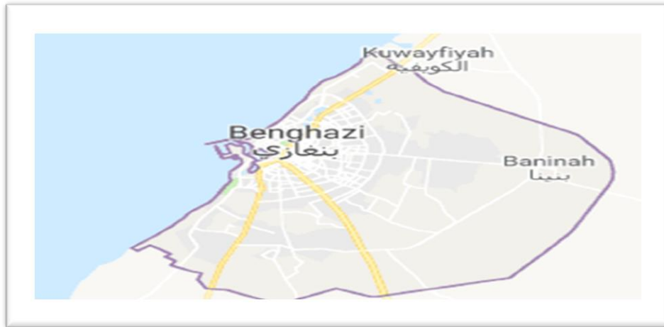
شكل رقم (1)

تقع مدينة بنغازي في شمال شرق ليبيا في السهل الساحلي الذي يعرف باسم سهل بنغازي وتعتبر المدينة الثانية بعد مدينة طرابلس ومركزا إداريا مهما يقدم خدماته لشرق وجنوب شرق ووسط البلاد، وتندرج المدينة فلكياً بين دائرتي عرض 32.03 - 32.10 ° شمالاً، وخطي طول 20.01 - 20.09 شرقاً (الأوجلي، 2012) شكل رقم (1).