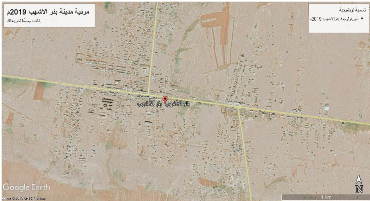
مرنية (2) مدينة بئر الأشهب سنة 2019م

يتضح من بيانات الجدول (1) والشكلين (1) و (2) ما يلي: