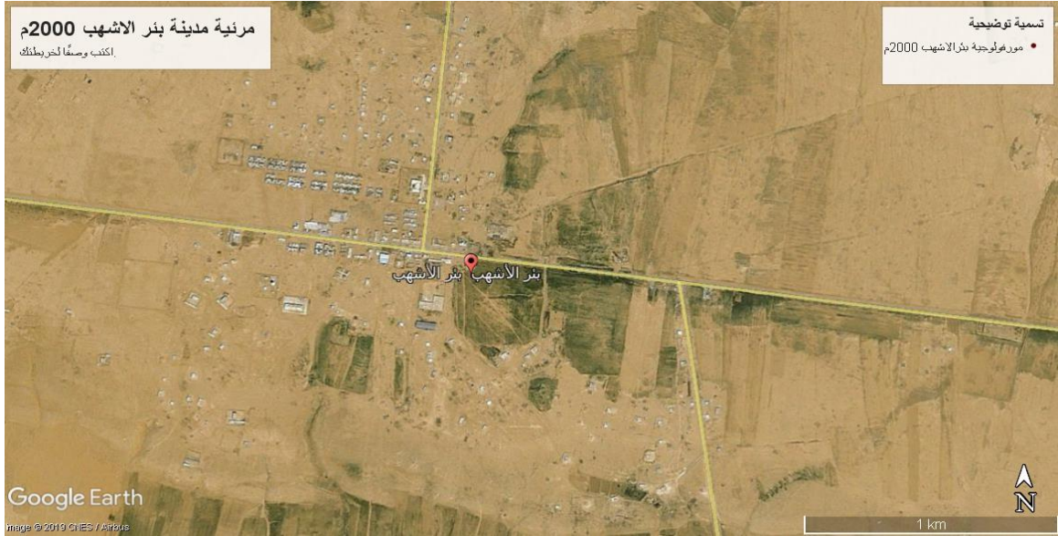
مرنية (1) مدينة بئر الأشهب سنة 2000م